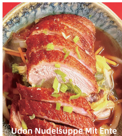
Udon Nudelsuppe Mit Ente