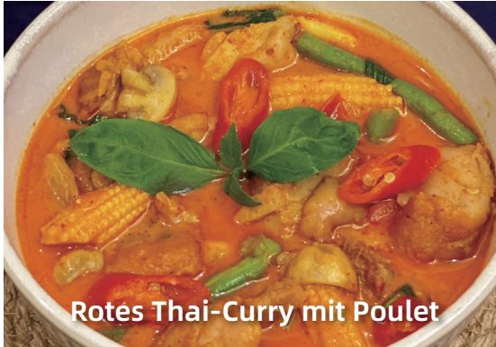
Rotes Thai-Curry mit Poulet

Serviert mit gedämpfem Calrose Reis Served with steamed Calrose rice 配玫瑰白米饭