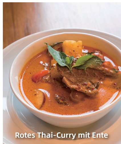
Rotes Thai-Curry mit Ente