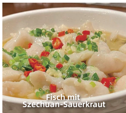
Fisch mit Szechuan-Sauerkraut