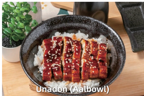
Unadon (Aal bowl)