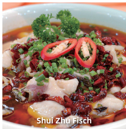
Shui Zhu Fisch