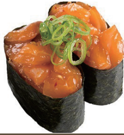
Lachstartar Gunkan (scharf)