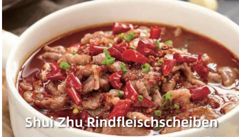
Shui Zhu Rindfleischscheiben

Serviert mit gedämpftem Calrose Reis Served with steamed Calrose rice 配玫瑰白米饭