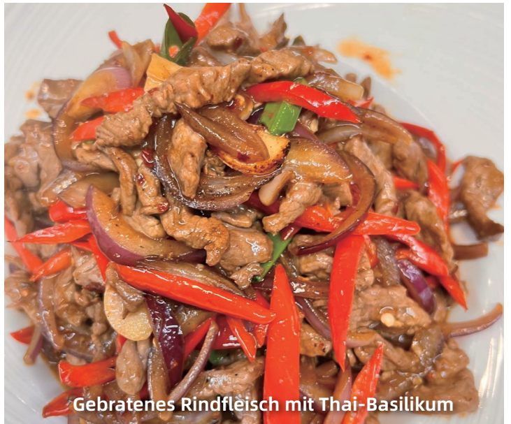
Gebratenes Rindfleisch mit Thai-Basilikum