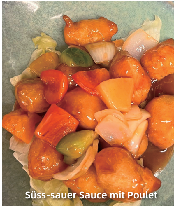
Süss-sauer Sauce mit Poulet